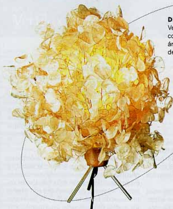
DE DESCARTE Velador realizado con hojas secas de árboles de plata, de Fabro