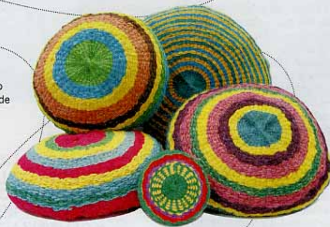
TEJIDOS Almohadones en lana pura de oveja hilada con huso y tejida en bastidor, de Elementos Argentinos