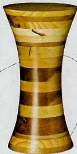
MADERA Un banquito lúnea Bois, hecho con maderas recicladas y comercializado por Fabro