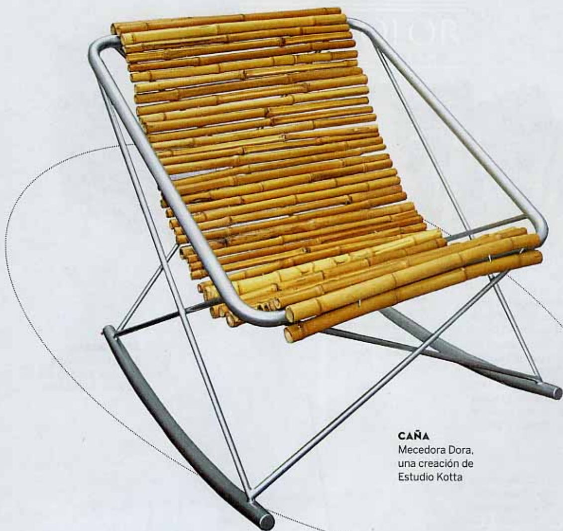
CAÑA Mecedora Dora, una creación de Estudio Kotta